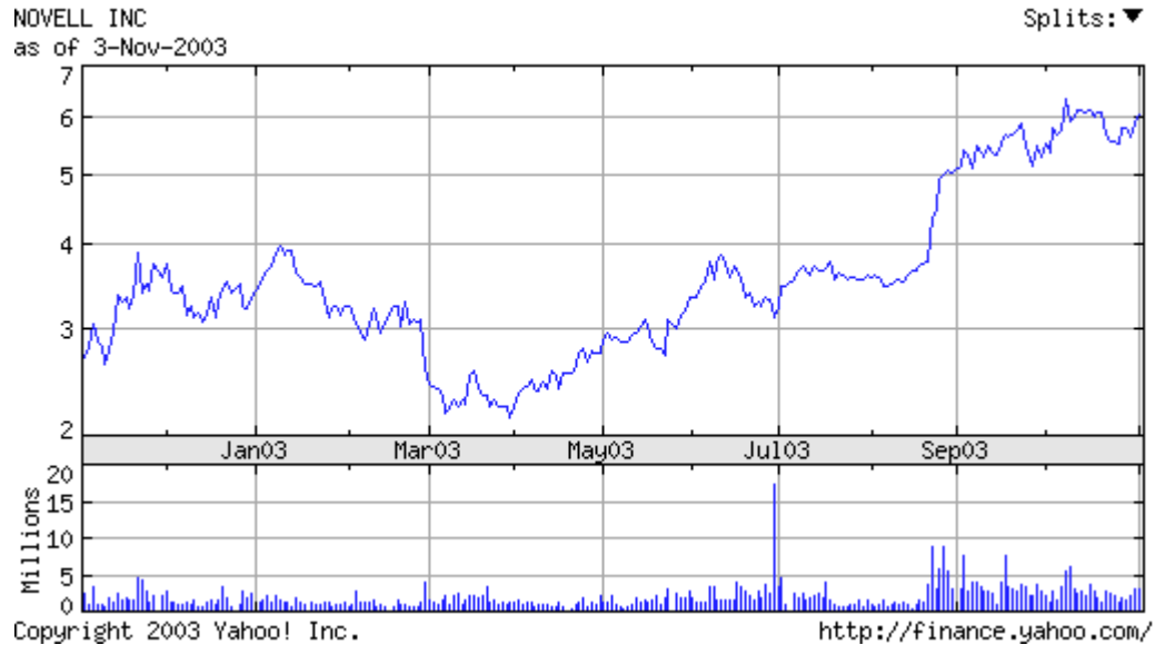
NOVELL (NASDAQ: NOVL – ostatnie 12 miesięcy.)

Kupić linuksa to dla wielu nie koniecznie oznacza kupienie pakietu oprogramowania systemu operacyjnego popularnego potocznie jako LINUX. Kupić linuksa można kupując również spółkę „linuksowa“. Tak zdecydował właśnie NOVELL znany ze swojego zaangażowania na rynku linuksowym. Już od dłuższego czasu widac było wyraźne zainteresowanie tej spółki konkurencyjnym systemem operacyjnym.